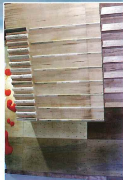
トレーニングコーナー